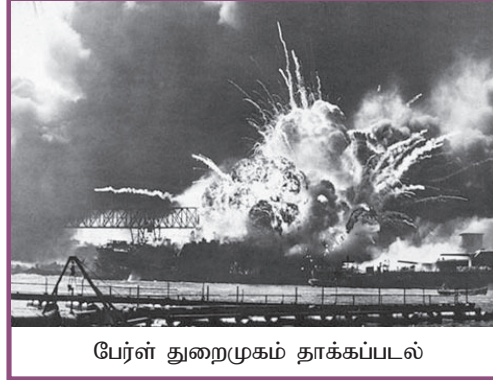
பேர்ள் துறைமுகம் தாக்கப்படல்

ஐரோப்பாவில் முன்னெடுத்துச் செல்கையில், ஐப்பான் ஆசியாவில் பேரரசொன்றை கட்டியெழுப்பும் வகையில் செயற்பட்டது. எனினும் குடியேற்றங்களில் பல பிரித்தானியா, பிரான்ஸ், அமெரிக்கா போன்ற நாடுகளின் கீழ் இருந்ததால் பேரரசைக் கட்டி எழுப்ப ஐப்பான் இந்த ஏகாதிபத்தியங்களுடன் போராட வேண்டிய நிலை ஏற்பட்டது. இந்நிலையில் ஹவாய் தீவில் அமைந்திருந்த அமெரிக்கக் கடற்படை அதன் முன்னேற்றத்திற்குத் தடையாக அமைந்திருந்ததனால் பேர்ள் துறை முகத்தில் நிறுத்தப்பட்டிருந்த அமெரிக்கக் கடற்படை மீது ஐப்பான் குண்டு வீசித் தாக்குதல் நடத்தியது.