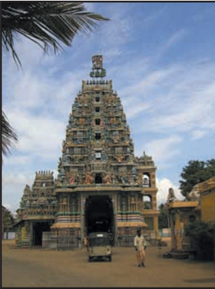
உரு 8.21 இந்துக் கோவில்

இலங்கையில் பௌத்தர்கள் தலதாமாளிகை, ஸ்ரீமகாபோதி, ஸ்ரீபாத, களனிவிகாரை, ருவன் வெலிசாய ஆகிய புண்ணிய தலங்களுக்கு சென்று வழிபாடுகளைச் செய்யத் தவறுவதில்லை.