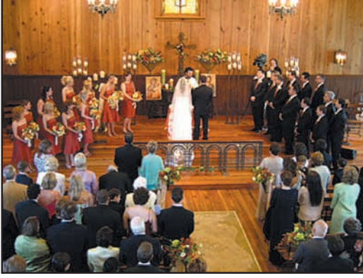
உரு 8.20 கிறிஸ்தவ திருமண சடங்கு

ஆலயத்தின் மணி ஒலிக்கும். இன்னிசைக் கீதங்கள் பாடப்படும். பின்னர் உறவினர்களும், நண்பர்களும் மணமக்களை வாழ்த்தி பரிசுப் பொருட்களை வழங்குவார்கள்.