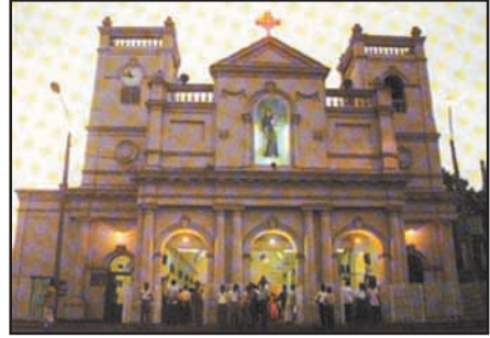
உரு 8.23 கத்தோலிக்கத் தேவாலயம்

பௌத்தர்களும் இந்துக்களும் பொதுவாக கதிர்காமம், முன்னேஸ்வரம் போன்ற கோவில்களுக்கு சென்று வழிபடுவார்கள். அதே போல கொச்சிக்கடை புனித அந்தோனியார் ஆலயத்திற்கு சமய, மொழி இனவேறுபாடு இன்றி எல்லோரும் சென்று வழிபடுவதனை நாம் காணலாம். ஸ்ரீபாத எனப்படும் சிவனொளிபாதமலை இலங்கையில் சகல இன மத மக்களும் புனிதப் பிரதேசமாகக் கருதப்படுகிறது.