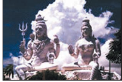
உரு 8.11 சிவனும் பார்வதியும்

சிவபெருமானிடம் இருந்து அருளைப் பெற்றுக் கொள்ளும் முகமாக விரதம் அனுஷ்டித்து இரவு முழுவதும் விழித்திருந்து வழிபாடுகளில் ஈடுபடுவது மகா சிவராத்திரி எனப்படும். இது மாசிமாதத்தில் சைவ மக்களால் கொண்டாடப்படுகின்றது. இது சைவ மக்கள் அனுஷ்டிக்கும் விரதங்களில் மிகவும் முக்கியமானதொன்றாகும்.