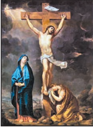
உரு 8.17 (i) இயேசுவின் பாடுகள்