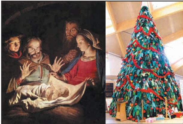
உரு 8.16 இயேசு பிறப்பும் நத்தார் அலங்காரமும்

இறைவன் தன் ஒரே மகனை இவ்வுலகிற்கு அனுப்பிய நாளாக இயேசுவின் பிறப்பு விழாவை கிறிஸ்தவர்கள் கொண்டாடுகிறார்கள். உலகம் பூராகவும் டிசம்பர் மாதம் 25ந் திகதி கிறிஸ்மஸ் விழா கொண்டாடப்படுகிறது. மக்களைப் பாவவாழ்வில் இருந்து மீட்பதற்காக இயேசுவை இவ்வுலகத்திற்கு இறைவன் அனுப்பியதாக கிறிஸ்தவர்கள் நம்புகிறார்கள். அன்றைய தினம் புத்தாடை அணிந்து ஆலயத்திற்குச் சென்று ஆராதனைகளில் கலந்து கொள்வார்கள். கிறிஸ்மஸ் கீதங்கள் பாடுவார்கள். ஏழை எளியவர்களுக்குப் பரிசுப்பொருட்கள் கொடுத்து மகிழ்வார்கள். உறவினர்கள், நண்பர்கள் வீடுகளுக்குச் சென்று கிறிஸ்மஸ் வாழ்த்துக்களைத் தெரிவித்து மகிழ்ச்சியாக இயேசுவின் பிறப்பு விழாவை கொண்டாடுவார்கள்.