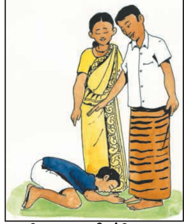
உரு 8.1 பெற்றோரை வணங்குதல்

பல்வகைமைச் சமூகத்தில் ஒவ்வொரு சமூகமும் ஏனைய சமூகங்களின் பழக்க வழக்கங்கள் சம்பிரதாயங்கள், விழாக்களுக்கு மதிப்புக் கொடுத்து, சகிப்புத் தன்மையுடன் நடந்து கொள்ளுதல் வேண்டும். இவ்வாறு புரிந்துணர்வுடன் நடக்கும்பொழுது பல்வகைமைத் தன்மை கொண்ட கலாசாரங்களை உள்ளடக்கிய சமூகம் நிலை பேறுடையதாகத் தொடர்ந்து இருக்கும்.