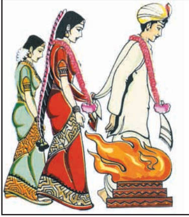
உரு 8.12 இந்த திருமண சடங்கு

தொடங்குவார்கள். எந்தக் கருமத்தையும் தொடங்குவதற்கு முன்பும் பிள்ளையாருக்கு முதல் வணக்கம் செய்வது இந்துக்களின் வழக்கமாகும். செய்யப்படுகின்ற காரியங்கள் தடை ஏற்படாமல் காக்க வல்ல கடவுள் பிள்ளையார் என்பது இந்துக்களது நம்பிக்கையாகும்.