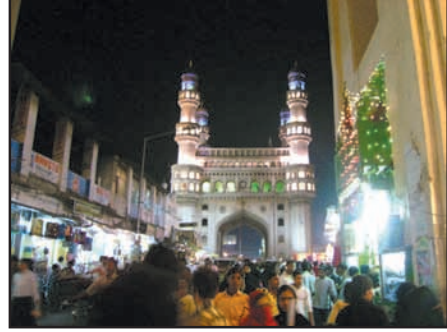
உரு 8.13 முஸ்லிம் பள்ளிவாசல்

இது அரபி மொழியில் 'ஈதுல் பித்ர்' எனப்படும். இஸ்லாத்தின் நான்காவது கடமையாகிய புனித நோன்பை நிறைவேற்றிய பின்பு நோன்புப் பெருநாள் கொண்டாடப்படுகிறது. இஸ்லாமிய ஹிஜ்ரி ஆண்டுக்கணக்கின்படி எட்டாவது மாதமான ரமழான் மாதம் முழுதும் முஸ்லிம்கள் நோன்பு நோற்பது கடமையாகும். நோயாளிகள் பிரயாணிகள் போன்றோருக்கு நோன்பு நோற்காதிருக்க அனுமதியுண்டு. ரமழான் மாதம் தலைப்பிறை பார்த்து முஸ்லிம்கள் நோன்பை ஆரம்பிப்பர்.