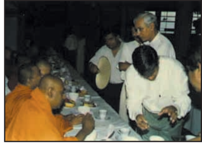
உரு 8.7 தானம் வழங்குதல்