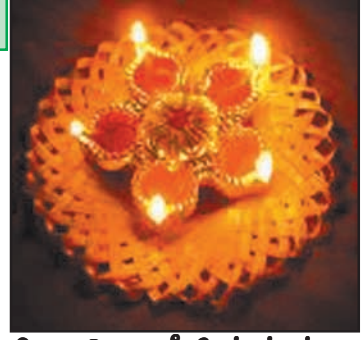
உரு 8.10 தீபமேற்றப்பட்ட காட்சி

நரகாசுரன் என்ற கொடும் அசுரனை கிருஷ்ண பகவான் அழித்த தினத்தைக் கொண்டாடுவதே தீபாவளி ஆகும். தீபங்களை வீடுகளிலும், கோயில்களிலும் ஏற்றிக் கொண்டாடுவதனாலேயே தீபாவளி எனப்படுகிறது. தீபாவளி நாளில் அதிகாலையில் எண்ணெய் தேய்த்து ஸ்நானம் செய்வார்கள். புத்தாடைகள் அணிந்து கோவில் களுக்குச் சென்று விசேட பூசை வழிபாடுகளில் கலந்து கொள்வர். இத்தினத்தில் விசேட தீபாவளி உணவுப் பண்டங்கள் தயாரித்து நண்பர்களுக்கும், உறவினர்களுக்கும் விருந்தளித்துக் கொண்டாடுவது இந்துக்களின் வழக்கமாகும்.