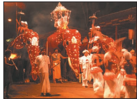
உரு 8.5 தலதா பெரஹெரா

காலம் காலமாக புத்தரின் புனித தந்தத்திற்குப் பூசை நடத்தும் முகமாக கண்டி ஸ்ரீ தலதா பெரஹெராவை பௌத்தர் நடாத்துவர். எசல ஆடி மாதத்திலே புத்த பெருமானை நினைத்து நாடுபூராவும் உள்ள விகாரைகளில் அன்னதானங்கள், தியானங்கள் மற்றும் புண்ணிய கருமங்களில் ஈடுபடுகிறார்கள்.