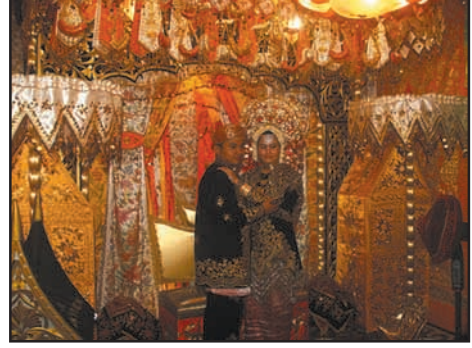
உரு 8.15 இஸ்லாமிய திருமணசடங்கு

திருமணம் இஸ்லாமியக் கோட்பாடுகளின்படி நடைபெறும். மணமகனதும், மணமகளினதும் வீட்டார் பேச்சுவார்த்தை செய்து மணமகன், மணமகள் சம்மதத்துடன் திருமணம் நிச்சயிக்கப்படும். மணப்பெண்ணின் தகப்பன் அல்லது சிறிய தந்தை அல்லது சகோதரர் அல்லது உறவினர் எவரும் மணப்பெண்ணுக்கு