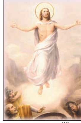
உரு 8.18 (ii) இயேசுவின் உயிர்ப்பு

சிலுவையில் அறையப்பட்டு, அடக்கம் செய்யப்பட்ட இயேசுகிறிஸ்து மூன்றாம் நாள் உயிர்த்தெழுந்ததை நினைவு கூரும் நாளாக கிறிஸ்தவர்கள் உயிர்ப்பு விழாவை கொண்டாடுகின்றார்கள். 40 நாட்கள் தவக்காலமாக அனுஷ்டித்து விரதமிருந்து வழிபாடுகளில் ஈடுபடுவர். தவக் காலத்தின் இறுதி வாரத்தை புனித வாரமாக அனுஷ்டிப்பார்கள். புனித வாரத்தின் வெள்ளிக் கிழமையே பெரிய வெள்ளி எனப்படுகிறது. அதனைத் தொடர்ந்து வரும் ஞாயிற்றுக்கிழமை உயிர்ப்பு விழாவாகக் கொண்டாடுவார்கள்.