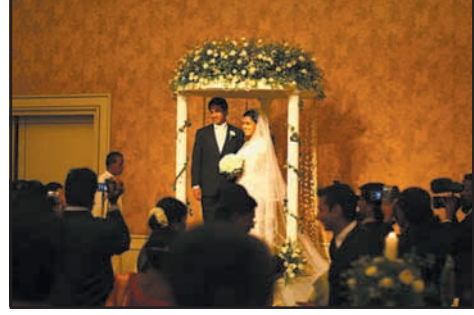
உரு 8.6 சிங்கள-பெளத்த திருமணம்

மரணச்சடங்கின் போது பிக்குமாரை அழைத்து வாழ்க்கையின் நிலையில்லாத தன்மை பற்றி தர்ம உபதேசம் கேட்டு பிக்குமாருக்குப் அங்கிகளை வழங்கி மரணித்தவருக்கு புண்ணியம் சேர்க்கும் பெளத்த சடங்கை நிறைவேற்றுவர். ஏழு நாட்களின் பின்னர். பிக்கு ஒருவரைக் கொண்டு ஞாபகார்த்தமாக தர்ம உபதேசம் செய்து, பின்னர் பிக்குமாருக்குத் தானம் வழங்கி மரணித்தவருக்குப் புண்ணியம் சேர்ப்பர்.