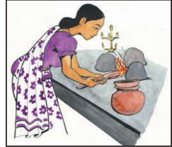
உரு 8.2 வருடப் பிறப்பின் போது உணவு தயாரித்தல்