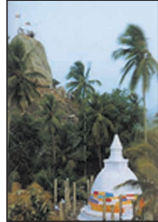
உரு 8.4 மிகிந்தலை

இலங்கைக்கு மஹிந்த தேரர் புத்த சமயத்தைக் கொண்டு வந்ததை நினைவு கூருமுகமாக இலங்கையின் எல்லாப் பாகங்களிலும் உள்ள பௌத்தர்கள் பொசன் கொண்டாடுகின்றனர். இக்கொண்டாட்டத்தின் போது மஹிந்ததேரரின் உருவச்சிலையை, ஊர்வலமாக (பெரஹெர) எடுத்துச் செல்வது பௌத்தர்களின் வழக்கமாகும். விசேடமாக அனுராதபுரம், மிகிந்தலை மற்றும் நாட்டின் சகல விகாரைகளிலும் மஹிந்த தேரரை ஞாபகப்படுத்திக் கொண்டாட்டங்களை ஏற்பாடு செய்கிறார்கள். இவ்வாறு செய்வதனை மஹிந்த தேரருக்குச் செய்யும் நன்றியாகவே கருதுகிறார்கள்.