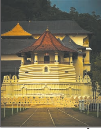
உரு 8.22 தலதா மாளிகை

இவ் ஆலயங்களுக்கு மக்கள் இலங்கையின் பல பாகங்களிலிருந்தும் சென்று வழிபாடுகளில் பங்கு கொள்ளுகின்றனர். முஸ்லிம்களைப் பொறுத்தவரை மக்காவிலுள்ள கஃபத்துல்லா பள்ளிவாசல், மதினாவில் உள்ள மஸ்கிதுத் நபவி - நபி முஹம்மத் (ஸல்) அவர்களின் பள்ளிவாசல், மற்றும் ஜெருசலேத்திலுள்ள புனித பைத்துல் முகத்துஸ் பள்ளிவாசல் ஆகியனவே முக்கியமான யாத்திரைத் தலங்களாகும். அவர்கள் அங்கு சென்று வழிபாடுகளில் ஈடுபடுவர்.