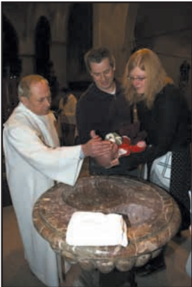
உரு 8.19 குழந்தைக்கு ஞானஸ்நானம் கொடுத்தல்

ஒரு குழந்தை பிறந்தவுடன் ஞானஸ்நானம் என்னும் சடங்கினை கத்தோலிக்க சமயத்தினர் செய்கின்றனர். பிறந்த குழந்தையை ஆலயத்திற்கு எடுத்துச் சென்று வழிபாடுகள் நடாத்தி குருவானவரால் ஞானஸ்நானம் வழங்கப்படுகிறது. ஞானஸ்நானம் மூலம் புதுவாழ்வு பெற்று இறைவனின் பிள்ளையாகுவதாக கிறிஸ்தவர்கள் நம்புகின்றனர்.