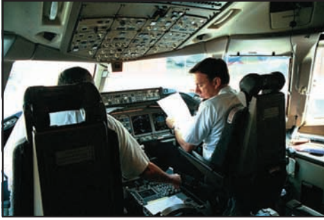
உரு 5.6 விமான ஓட்டுநர்

அநேகமான உற்பத்தி நிலையங்களில் தமது உற்பத்தித் தரத்தினை உயர்த்தும் நோக்கத்துடன் ஊழியர்களுக்குப் பயிற்சி அளிப்பது முக்கிய செயற்பாடாக மேற்கொள்ளப்படுகின்றது. இவ்வாறான பயிற்சிகள் வேலை பெறுவதற்கு முன்போ (Pre-job Training) அல்லது வேலை செய்யும் போதே (On-job training) வழங்கப்படுகின்றன. வேலை உலகில் எமக்குக் கிடைக்கின்ற தொழில்களை நாம் சிறப்பாக மேற்கொள்வதற்கு விசேடமாகப் பயிற்றப்பட்ட ஊழியம் மிக அத்தியாவசியமானது. உதாரணமாக விமானம் செலுத்துதல், நோயாளிகளுக்கு அறுவைச் சிகிச்சை செய்தல், புதிய இயந்திர சாதனங்களை இயக்குதல் என்பவற்றுக்கு எமக்குப் பயிற்சி மிகவும் அவசியமாகும். அனுபவம் ஊடாக இந்தப் பயிற்சி மேலும் பயனுள்ளதாக மாறும். இது அவர் பெறும் விசேட நிபுணத்துவமாகும். இவ்வாறு பயிற்சி பெற்ற ஊழியர்கள் காணப்படுவதனுடாகத், தொழில் துறைகள் மிகவும் வெற்றிகரமாகச் செயற்படுவதனை நாம் அறியலாம்.