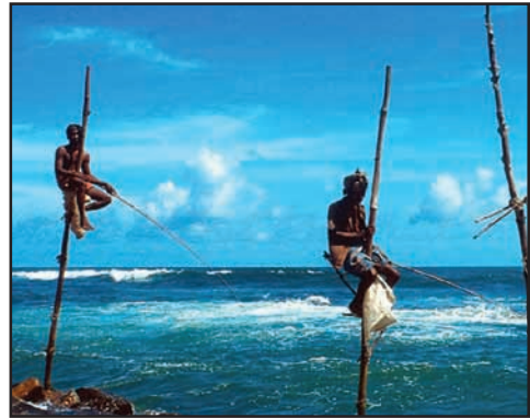
உரு 5.2 மீன்பிடித்தல்