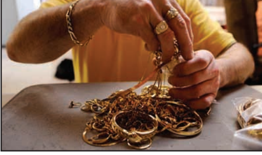
உரு 5.3 நகை செய்தல்

பாரம்பரியமாக மேற்கொள்ளப்பட்டு வரும் தொழில்களும் காணப்படுகின்றன. உதாரணமாகத் தங்க ஆபரண உற்பத்தி, முகமுடி உற்பத்தி, மட்பாண்ட உற்பத்தி, பித்தளைப் பொருள் உற்பத்தி போன்ற பாரம்பரியமான தொழில் துறைகளினூடாக மேற்கொள்ளப்படும் உற்பத்திகளுள் பெரும்பாலானவை நாட்டின் தேசிய அடையாளமாகவும் தேசத்தின் பெருமையாகவும் காணப்படுகின்றன.