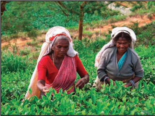
உரு 5.1 தேயிலை பறித்தல்

வைத்தியர், தாதியர், தாதி உதவியாளர்கள், சாரதி, சுத்திகரிப்புத் தொழிலாளி, வைத்தியசாலைப் பாதுகாப்பு அதிகாரிகள், தொழிலாளர்கள் எழுதுவினைஞர்கள், கணக்காளர்கள், சிகிச்சைக்கள பொறுப்பாளர்கள் போன்ற வேலைகளுக்காகக் காணப்படும் தொழில் வாய்ப்புகள் ஏராளமானவை. இவர்கள் அனைவரும் வைத்தியசாலையில் மேற்கொள்ளும் பணிகளுடாகத் தம்மிடையே பல்வேறுபட்ட தொடர்புகளைக் கொண்டுள்ளனர். இவர்கள் அனைவரும் தமது சேவையை மேற்கொள்வது பொது நோக்கத்தினை அடைவதற்காகவே. எனவே வைத்தியசாலையின் அனைத்து நடவடிக்கைகளும் பொது மக்களுக்குச் சேவை வழங்குவதற்காகவே மேற்கொள்ளப்படுகின்றன. வேலை உலகின் பல்வகைமைக்குப் பல்வேறு காரணிகள் பங்களிப்புச் செய்கின்றன. பல பிரதேசங்களில் காணப்படும் இயற்கை வளங்கள் அப்பிரதேசத்தின் ஒரு சாதகத் தன்மையாகும். பிரதேசத்தில் விசேடமாகக் காணப்படும் வளங்களினால் பல்வேறுபட்ட தொழில்கள் உருவாகின்றன. மலையகத்தில் தேயிலை உற்பத்தியும் மரக்கறிச் செய்கையும், நாட்டின் மத்திய பிரதேசத்தில் பூக்கள் உற்பத்தி, கடலோரப் பிரதேசங்களில் மீன்பிடி நடவடிக்கை, வெவல்தெனிய பிரதேசத்தில் பிரம்புத் தொழில் போன்ற பல்வேறுபட்ட தொழில்கள் பிரதேச அடிப்படையில் நிகழ்கின்றன.