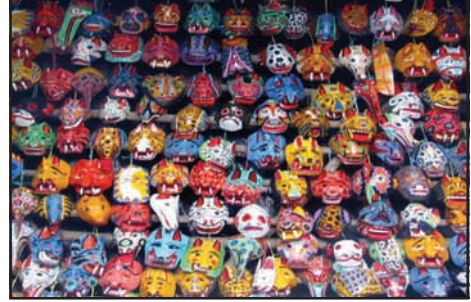
உரு 5.4 முகமுடிக் கைத்தொழில்

தொழில் வழங்கும் துறைகளும் வேலை உலகின் பல்வேறுபட்ட தன்மைகளும்