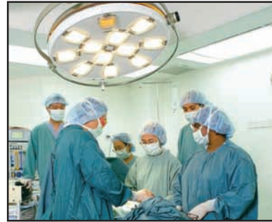
உரு 5.7 வைத்திய சேவை

சில உடல் உழைப்பினைப் பயன்படுத்தும் தொழில்களுக்கு விசேட பயிற்சிகள் அவசியமற்றதாகும். ஆனால் வளர்ச்சியடைத்துவரும் உலகில் அநேக செயற்பாடுகளுக்காகச் சிறப்பான முறைகளைப் பாவிப்பதற்கான வாய்ப்புகள் உள்ளன. பயிற்சியற்ற ஊழியர்களுக்குப் பயிற்சி அளிப்பதன் மூலம் அத்தொழிலில் உற்பத்தித் திறனையும் செயற்றிறனையும் அதிகரிக்க முடியும்.