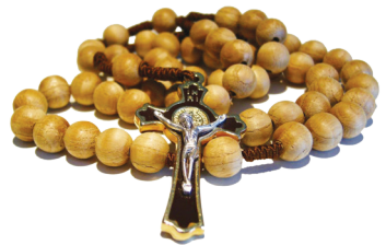
17.3 படம் திருச்செபமாலை