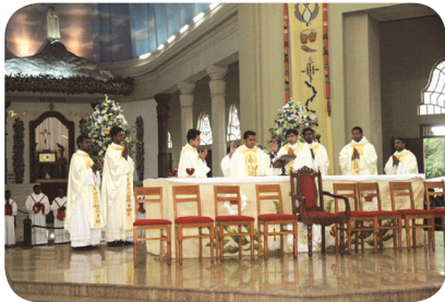
17.1 படம் திருப்பலி