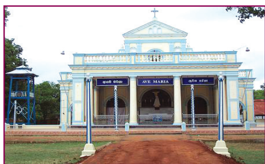
3.1 රූපය - ශ්‍රී ලංකාවේ ආගමික ස්ථාන කිහිපයක්